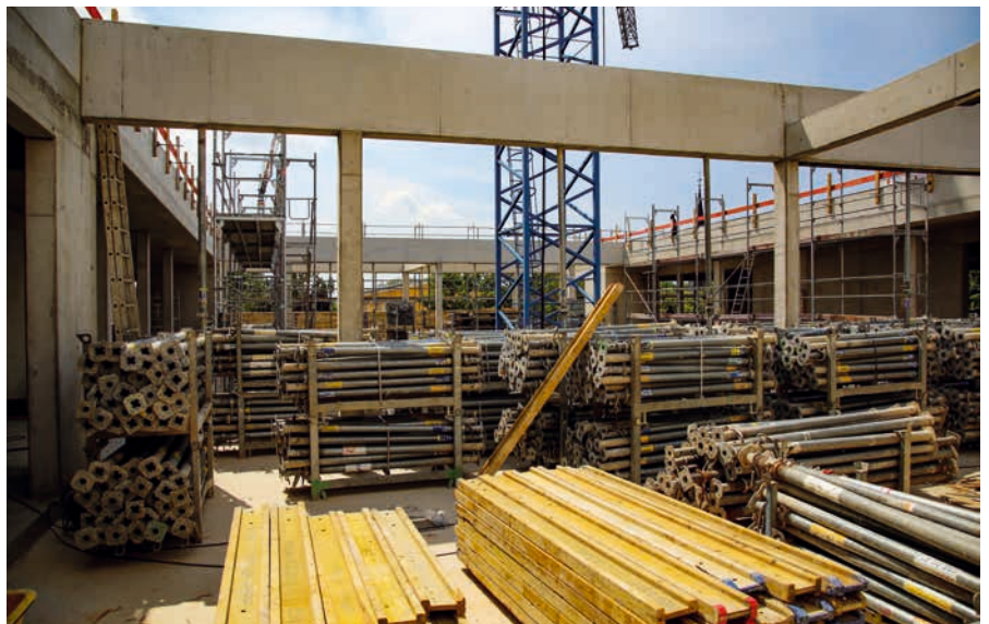
Läuft: Auf der Großbaustelle der Grundschule Ost geht es gut voran.