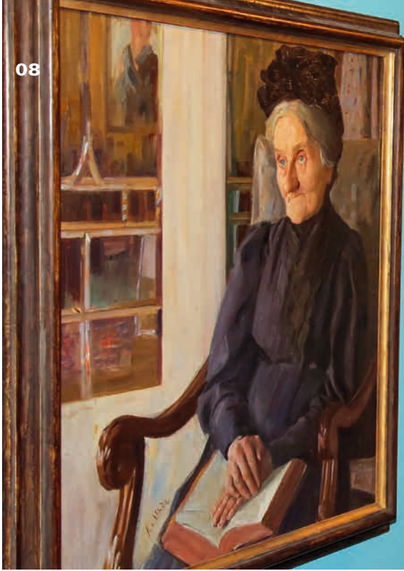
Schau, wie ich schau! Ausstellung „Was Blicke erzählen“ in der Gemäldegalerie.