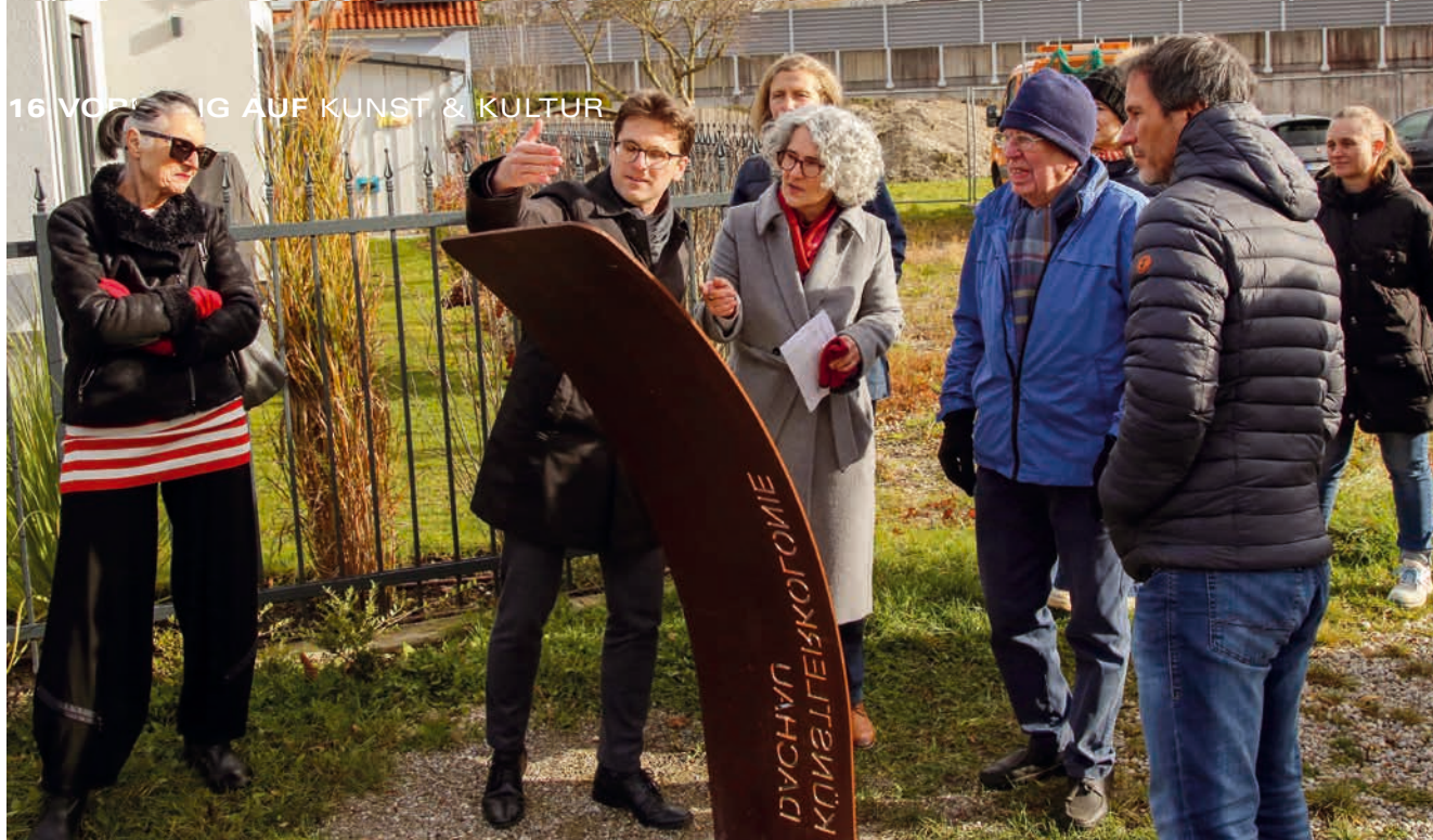
Im November wurde der Künstlerweg Etzenhausen eröffnet.