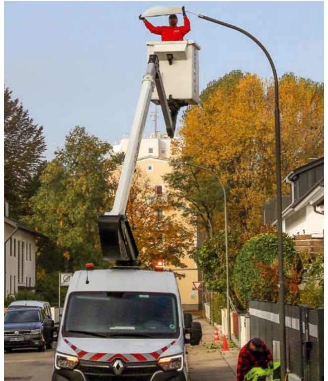
Alte Leuchte runter, neue Lampe rauf: Umrüstung auf LED.

» Mitte Oktober: Beginn einer gewaltigen Umrüstaktion: Binnen weniger Monate werden 2.600 Straßenlater-