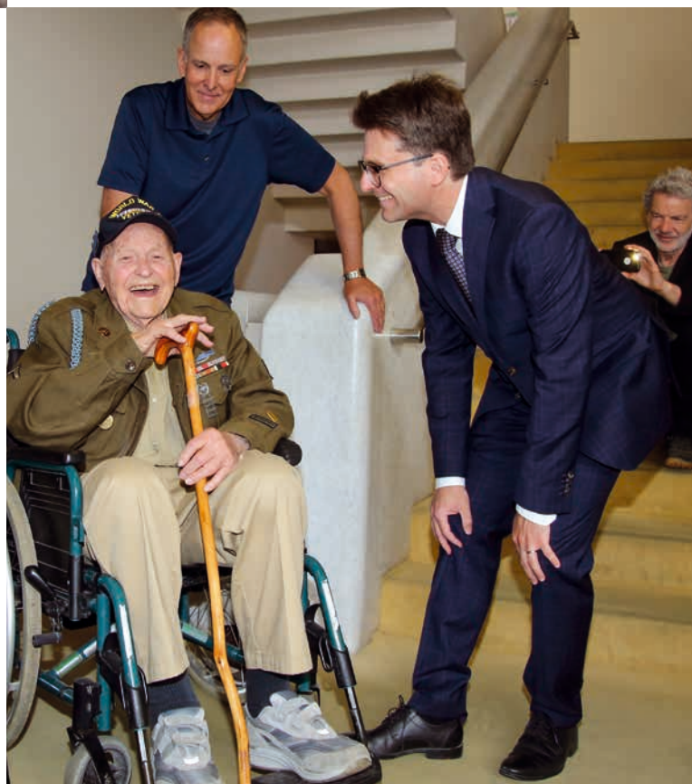
Rückkehr nach Dachau: Ein Befreier des KZ beim Empfang im Rathaus.

» 23. Juni: Auf der Baustelle der Grundschule Dachau-Ost kann Richtfest gefeiert werden. Der Neu- und Erweiterungsbau ist in vollem Gange und im Zeitplan. Mit der Erweiterung entsteht eine