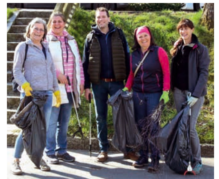
Dass gemeinsamer Einsatz für die Umwelt Spaß macht, beweist diese Gruppe.

Natürlich gibt es wie gewohnt eine kleine Belohnung: Die Stadt lädt alle Teilnehmer nach dem Müllsammeln ab 11.30 Uhr zu einer stärkenden Brotzeit in das Gasthaus „Drei Rosen“ ein. Ganz herzlichen Dank an alle großen und kleinen Helfer! ■