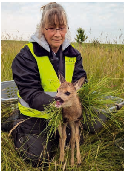
Dank Wärmebilddrohne: Sieben Kitze gerettet.

» Mitte November: Die Laufstreifen in der Altstadt werden weiter ausgebaut. Nun wird zwischen Widerstandsplatz und Martin-Huber-Treppe das alte, holprige Pflaster gegen neue, ebene Steine ausgetauscht. Die Laufstreifen erleichtern es Menschen, die nicht so gut zu Fuß sind, sich in der Altstadt zu bewegen. ■