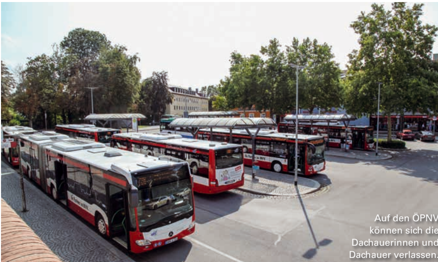
Auf den ÖPNV können sich die Dachauerinnen und Dachauer verlassen.