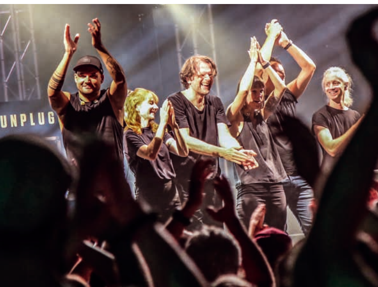
Applaus fürs Wetter: Beim Musiksommer konnte es 2025 kaum schöner sein.

» 12. Juli: Am Tag der offenen Tür der Freiwilligen Feuerwehr strömen wieder tausende Besucher auf das Gelände. Vor allem bei Kindern ist die Veranstaltung äußerst beliebt. An diesem Tag wird auch der neue Übungscontainer eingeweiht. An verschiedenen Gerätschaften zeigen die Feuerwehrler ihr Können – und auch die Kinder durften das eine oder andere Feuerchen löschen.