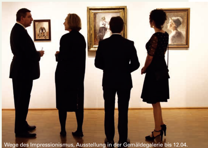
Wege des Impressionismus, Ausstellung in der Gemäldegalerie bis 12.04.