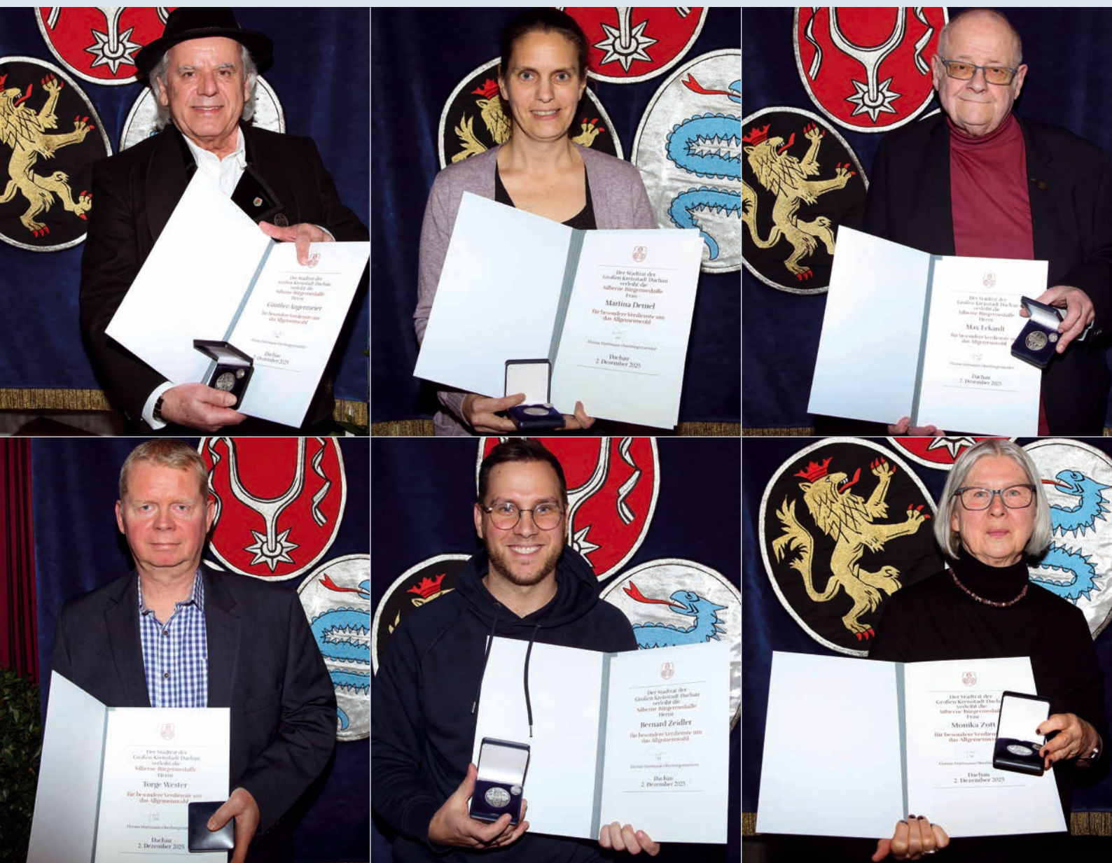
Ehrung engagierter Dachauerinnen und Dachauer mit der Silbernen Bürgermedaille (S. 10/11)