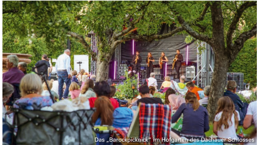
Das „Barockpicknick“ im Hofgarten des Dachauer Schlosses

Der Vorverkauf für die einzelnen Veranstaltungen des Dachauer Musiksommers 2026 läuft bereits seit mehreren Wochen. Karten erhalten Sie bei MünchenTicket, sowohl online als auch in allen VVK-Stellen wie der städtischen Tourist-Information am Karlsberg. Freuen Sie sich auf ein abwechslungsreiches Programm!